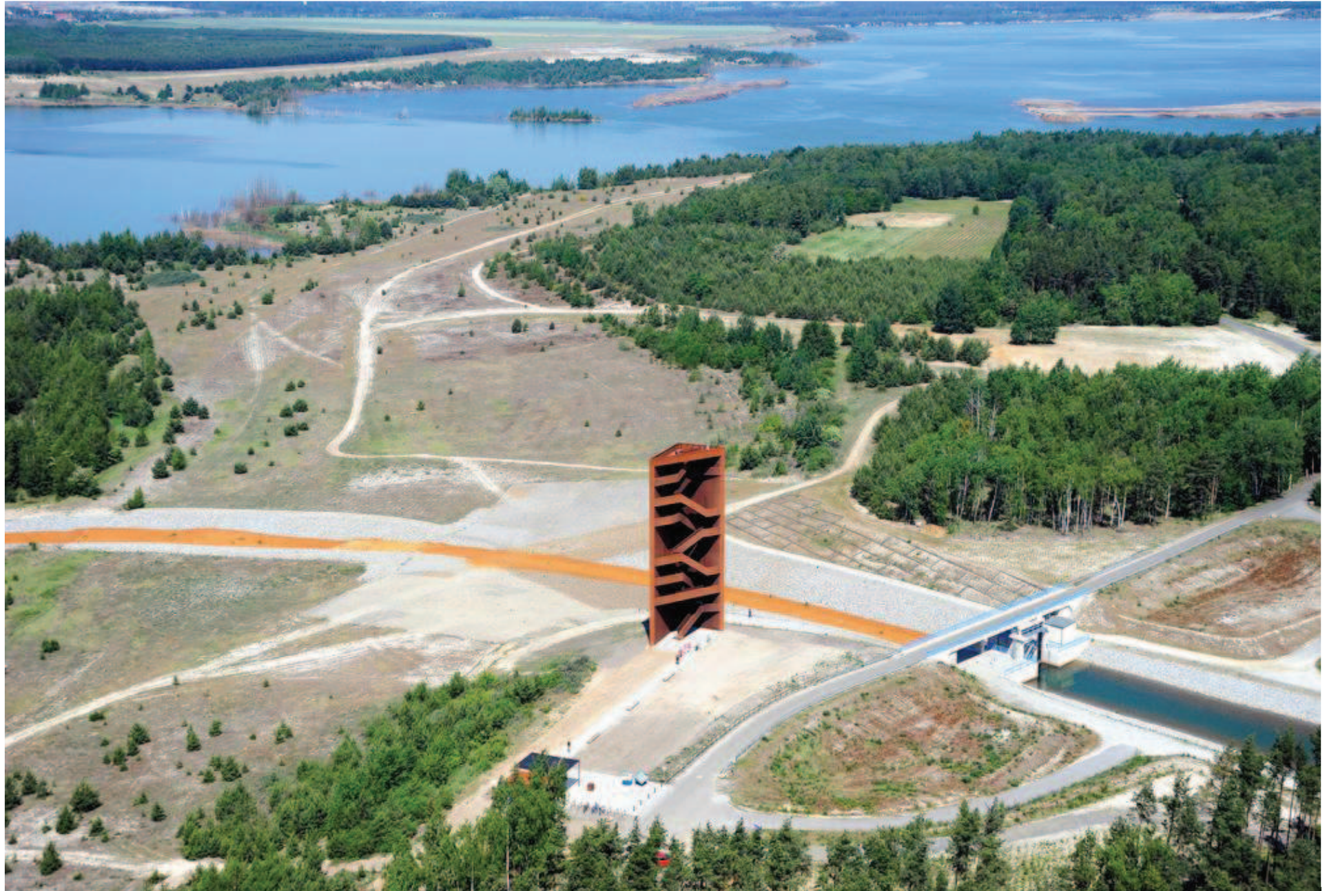
Landmarke Lausitzer Seenland: Eröffnung 2008 (Entwurf: Stefan Giers/Architektur und Landschaft, München)