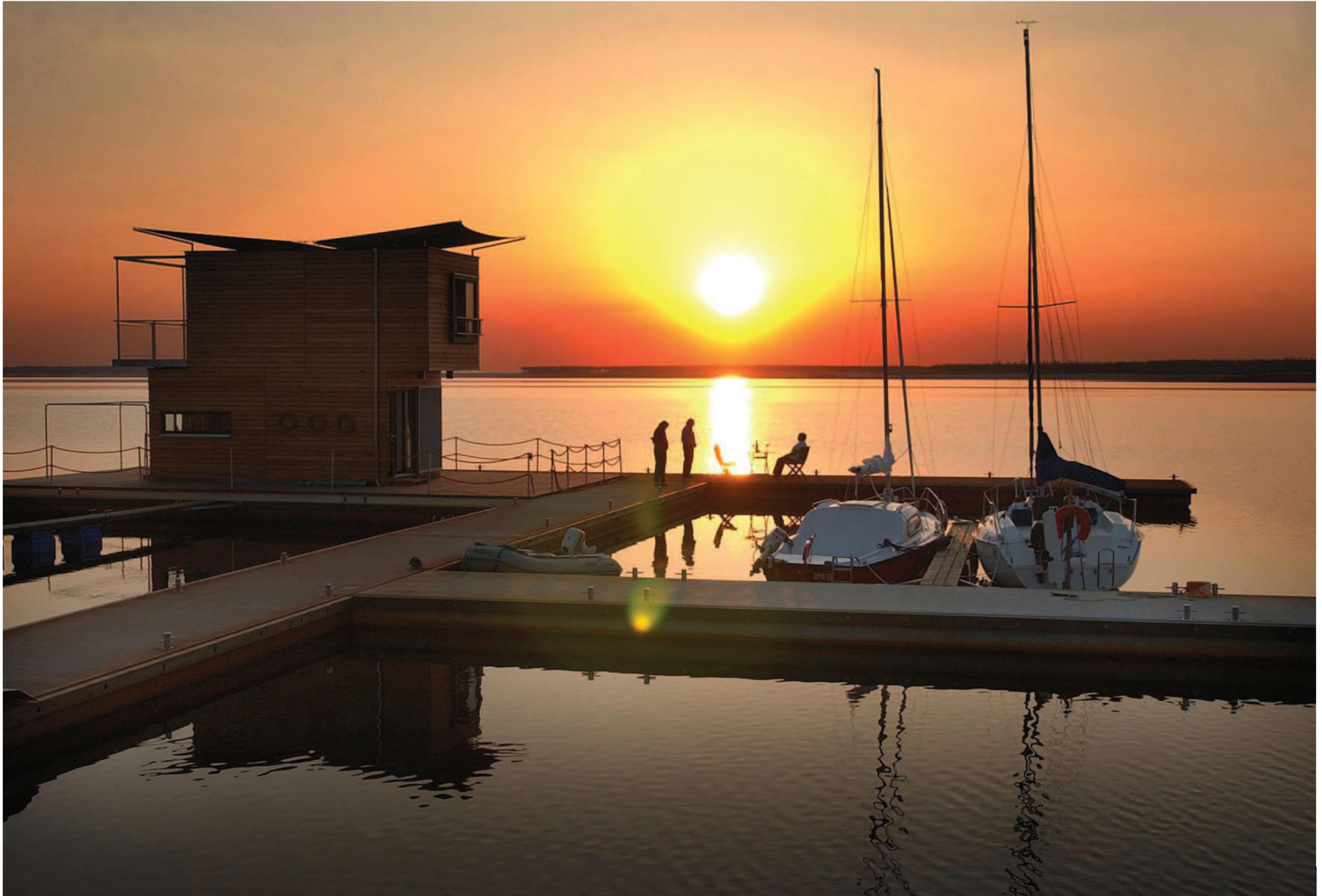
Markenzeichen: Schwimmende Architektur