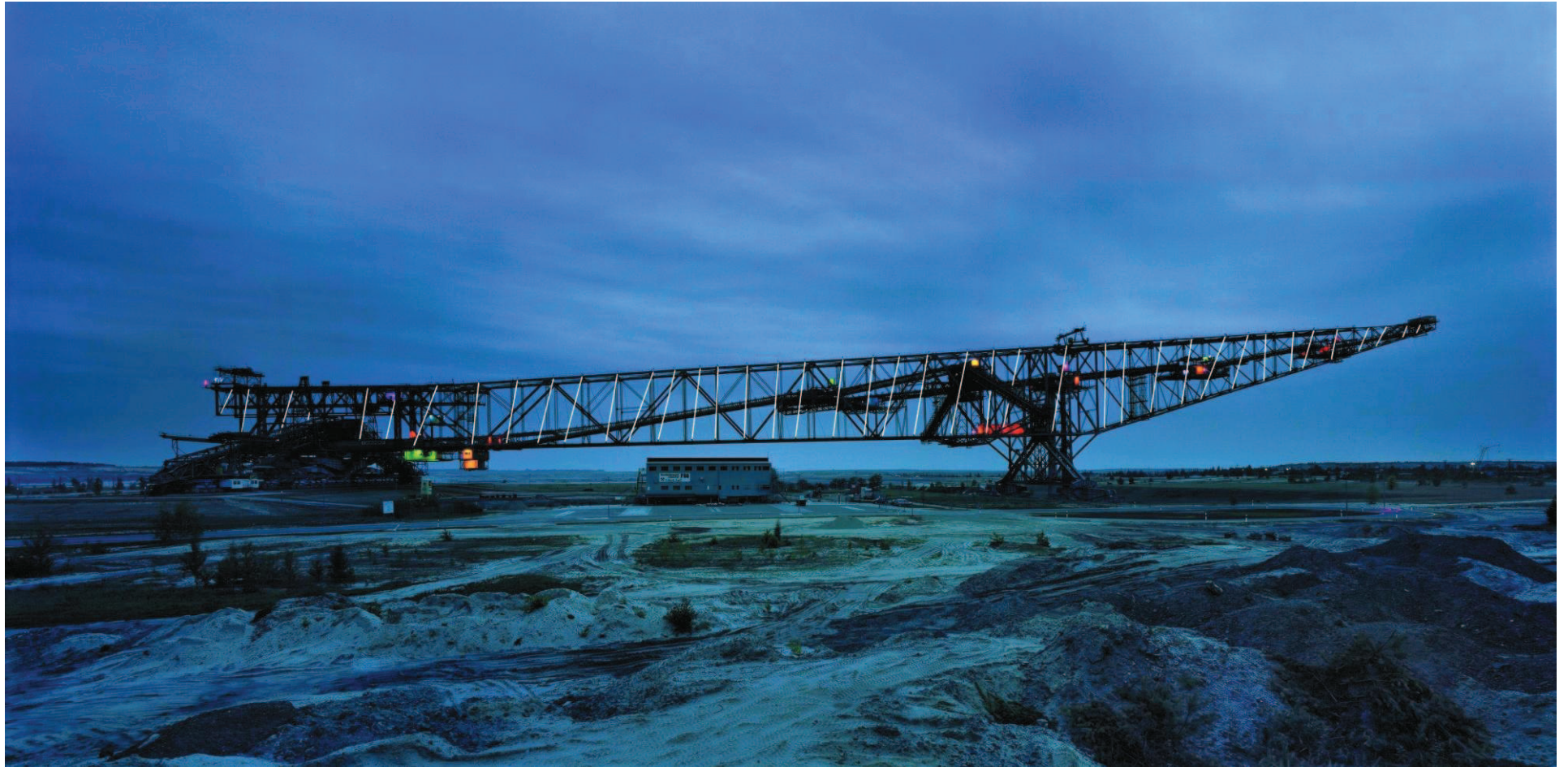
F60 in der Landschaft