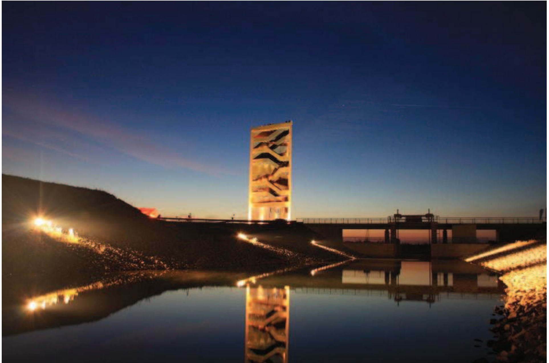
Wasserlandschaft Sedlitzer See: Landmarke (Giers & Giers) – Eröffnung am 23. Oktober 2008 mit Minister Dellmann, MIR