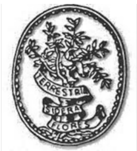
ORTICOLA DI LOMBARDIA