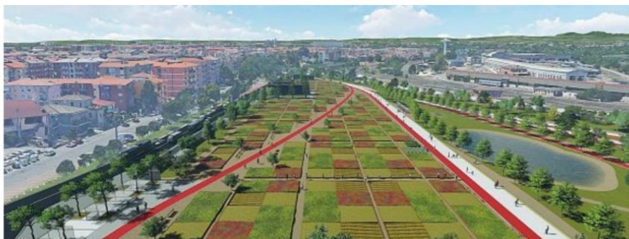
Central Park Un rendering, presentato in campagna elettorale dal neo sindaco Federico Sboarina, per il futuro dell'ex Scalo Merzi di Verona Sud. L'assessore Ilaria Segala ha presentato una proposta di delibera per un accordo con Rfi sulla base delle opere compensative sulla Tav.

Se per la realizzazione dell'Ingresso Est il Comune di Verona chiede - come opera compensativa - la realizzazione di un "Central Park", trasferendo tutte le attuali infrastrutture ferroviarie all'interno delle aree dell'Interporto: Quadrante Europa , parrebbe essere evidente che serve una VIA unica e unitaria .