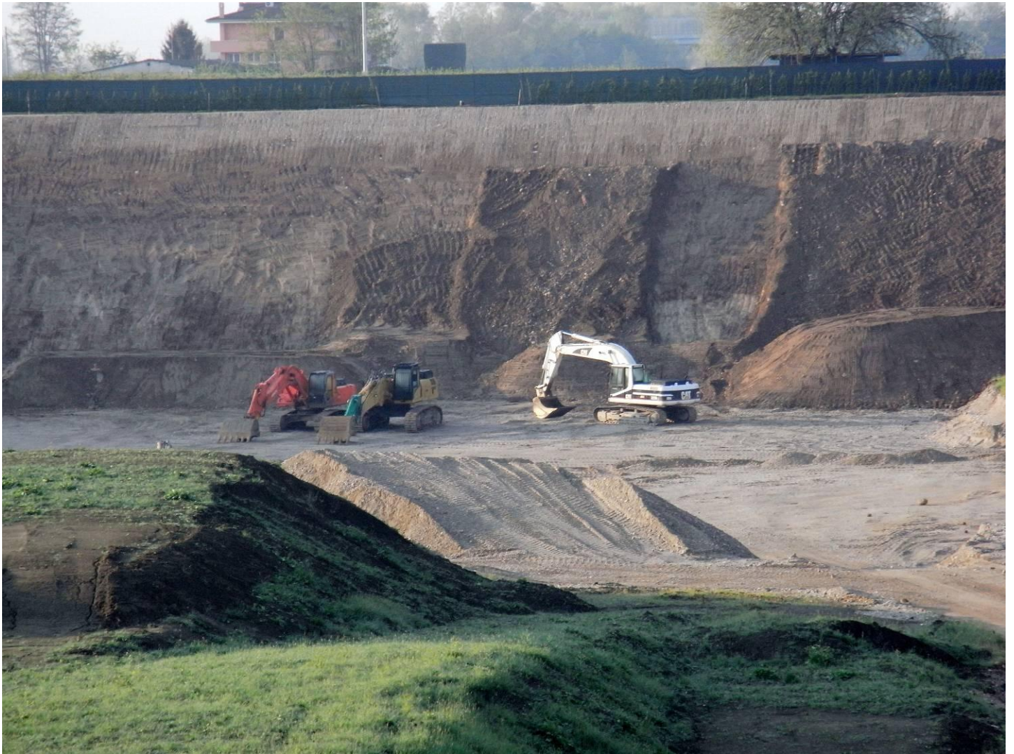
DETTAGLIO DELLA PARETE SUD DELL'EX CAVA VISTA DA NORD