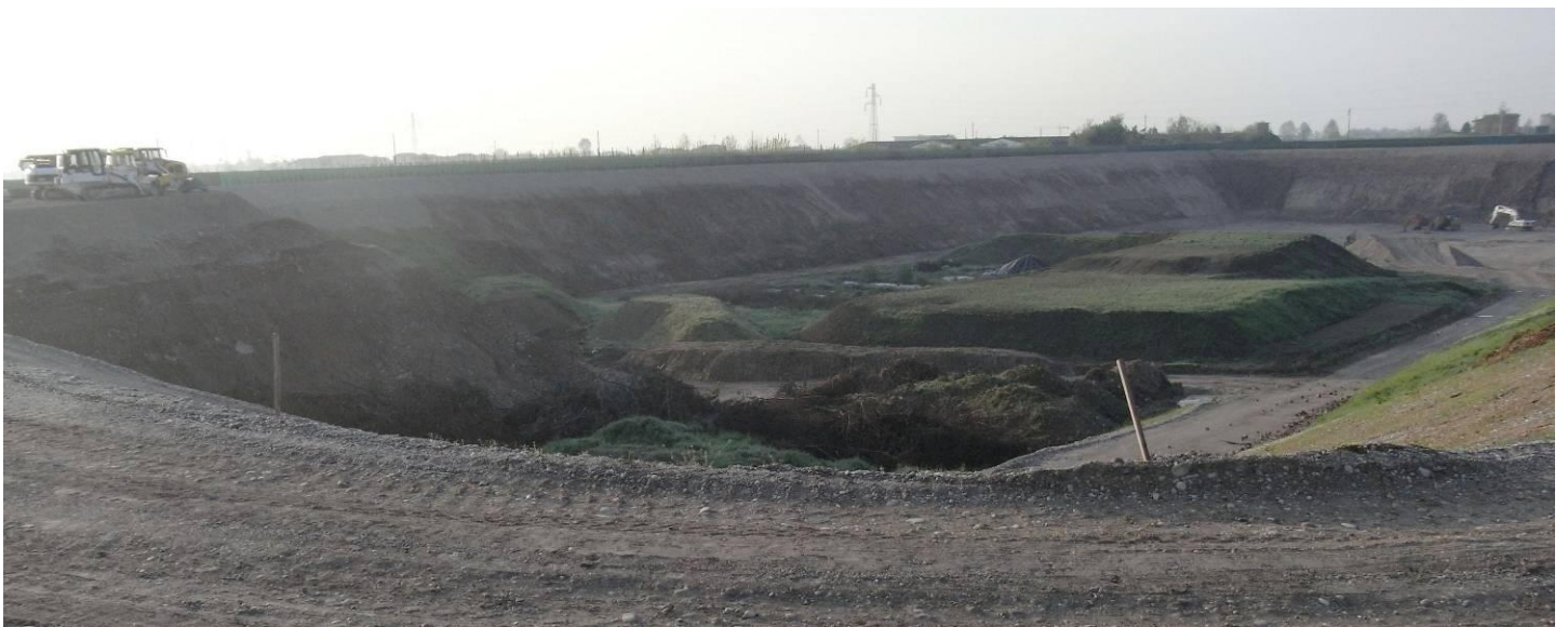
DETTAGLIO EX CAVA VISTA DA NORD