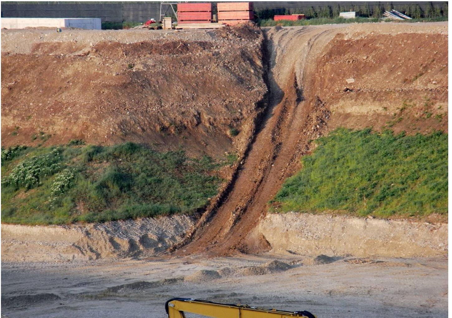
DETTAGLIO LATO OVEST - stesura di: Terreno vegetale limoso-sabbioso color marrone con ghiaia e rari ciotoli?