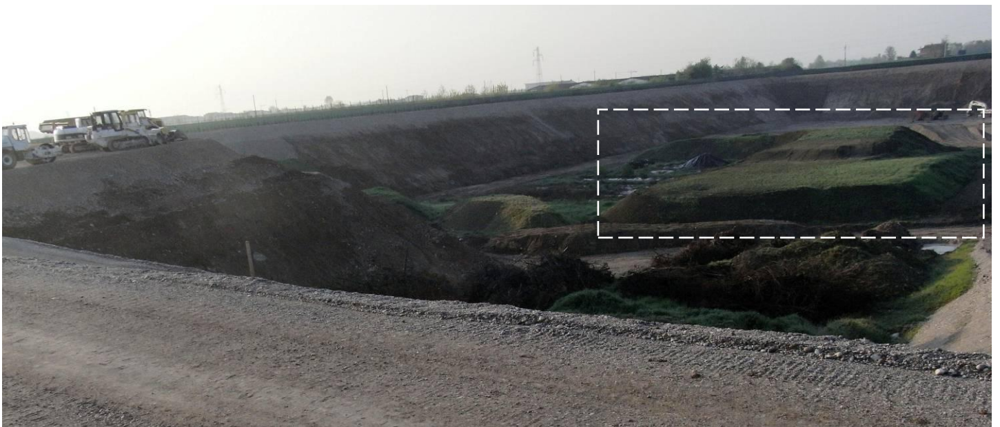
DETTAGLIO EX CAVA VISTA DA NORD

Nel riquadro l'argilla che dovrebbe servire alla realizzazione degli strati impermeabilizzanti della DISCARICA di RIFIUTI.