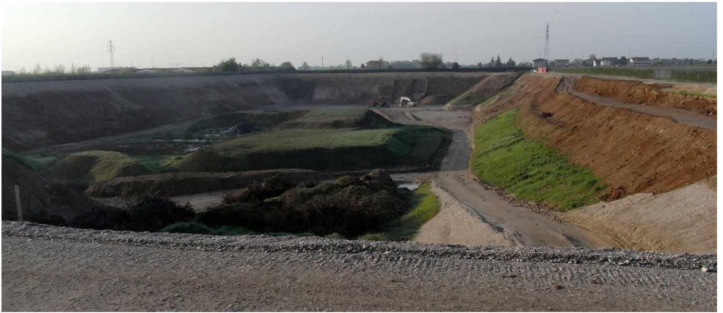
DETTAGLIO EX CAVA VISTA DA NORD