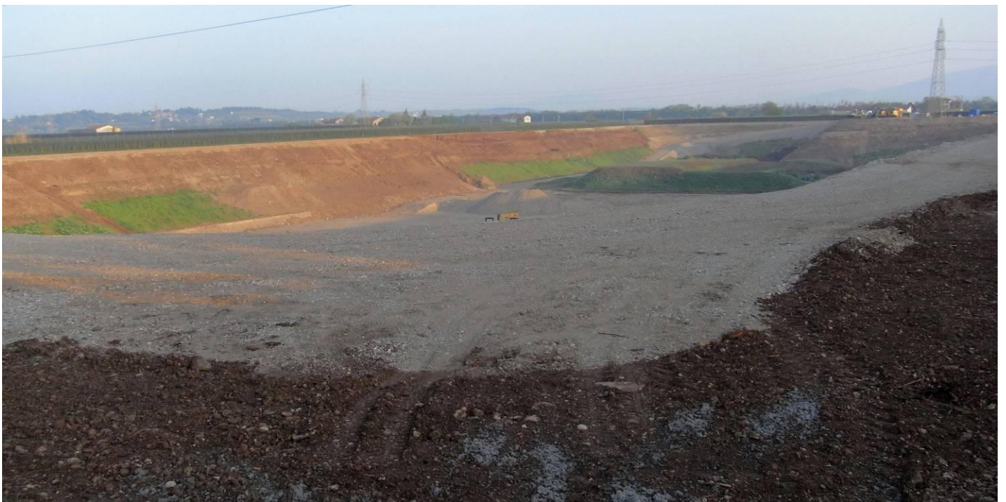
IMMAGINE RIPRESA DALL'ANGOLO SUD-EST dalla quale è evidente che sulla parete vi è stata stesura di: Terreno vegetale limoso-sabbioso color marrone con ghiaia e rari ciotoli con il quale TERRENO DI RIPORTO viene realizzata la risagomatura delle pareti dell'ex Cava Siberie

Da evidenziare che all'interno della recinzione dell'ex cava - DESTINATA A DISCARICA DI RIFIUTI - lungo tutto il lato est dell'area vi è un canale d'irrigazione "interrato"... a pochi centimetri, sotto la superficie della strada perimetrale.