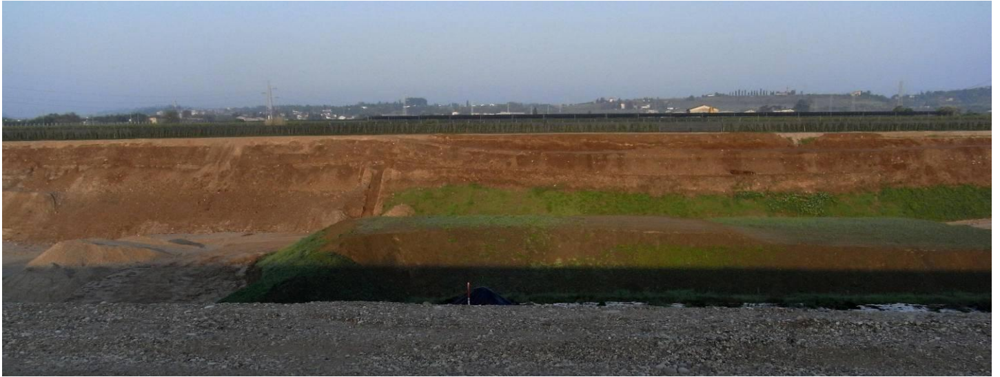
DETTAGLIO LATO OVEST - stesura di: Terreno vegetale limoso-sabbioso color marrone con ghiaia e rari ciotoli?